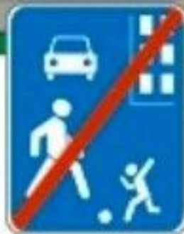
Знак "Конец жилой зоны"