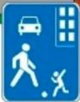
Знак "Жилая зона"

ПРАВИЛО 3: Не играй на проезжей части дороги даже во дворе собственного дома.