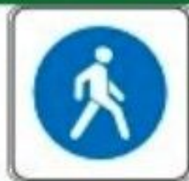
Знак "Пешеходная зона"